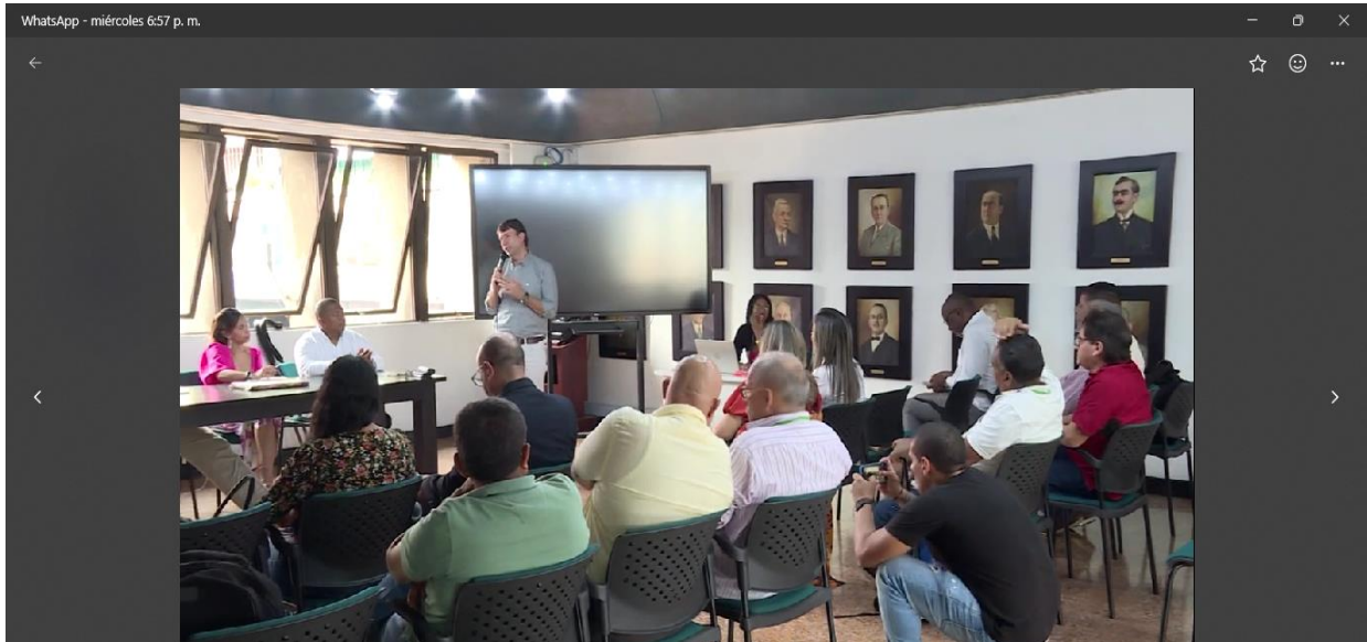
Evidencia Fotográfica: Mesa institucional