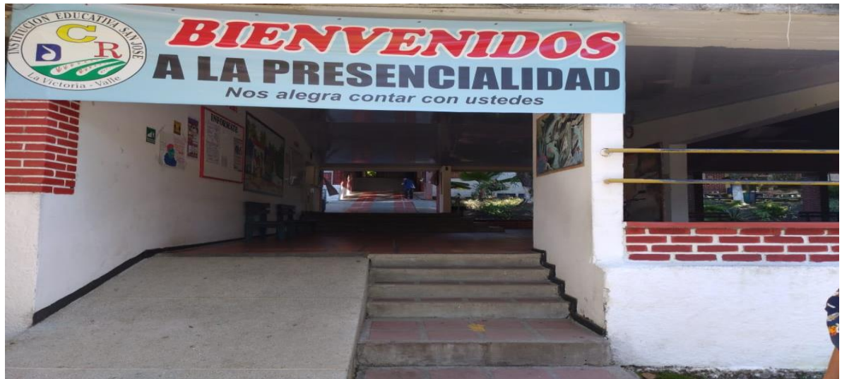
Mejoramiento de Cielo razos en pvc sede central