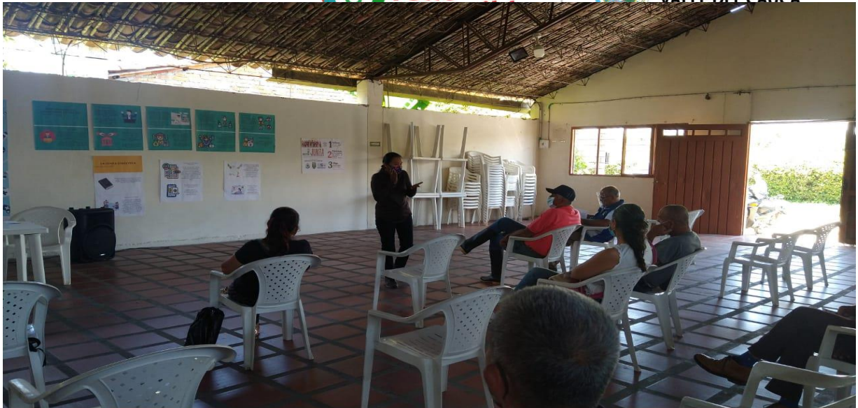
Consejo Directivo convoca a clases en alternancia Abril 2021