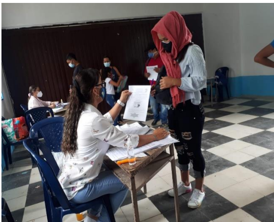
Actividad: recibimiento y entrega de guías de aprendizaje