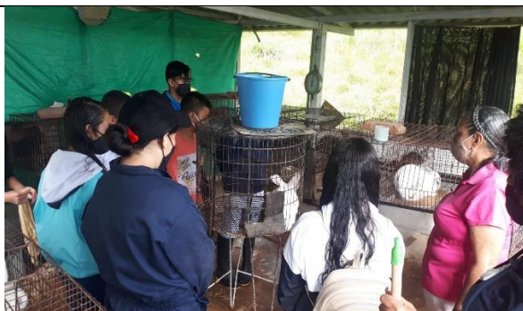
Actividad: Proyectos productivos cunicultura.