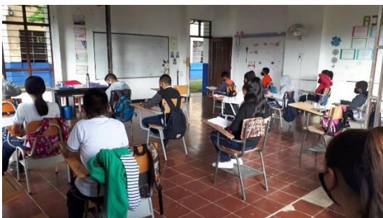
Actividad: Clases presenciales con los protocolos de bioseguridad.