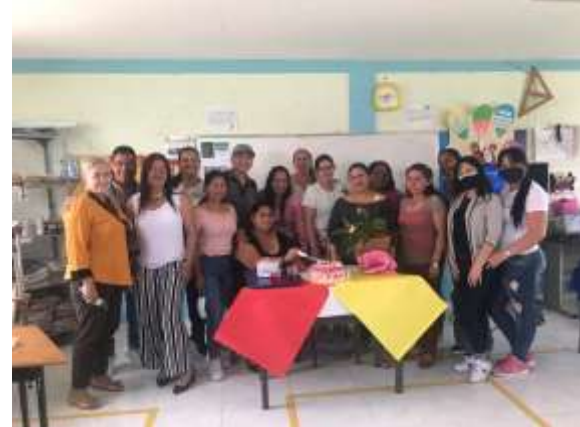
Actividad: Reunión de Docentes y Padres de familia Lugar: Blas de Leso-Potrerito