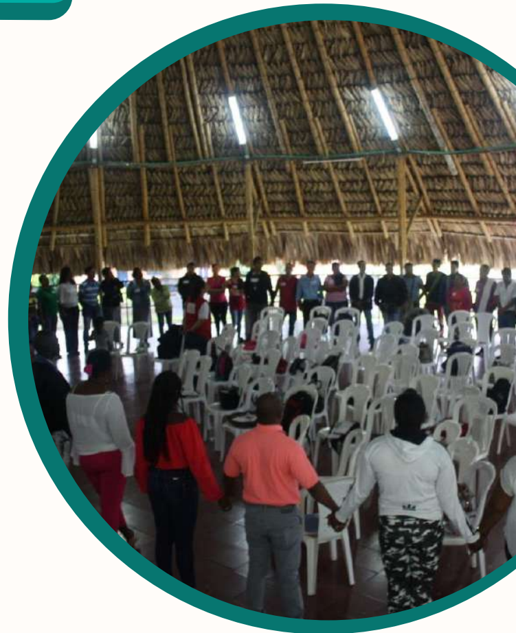
Reunión Grupo Motor de Florida

Frente a las iniciativas de desarrollo, expresa que ellos como comunidad han hecho la priorización acorde a sus necesidades, pero no se sienten recogidos en la priorización e implementación que ha iniciado la ART: "se debe priorizar el tema de tierras, distrito de riego, vías, producción, reconciliación, convivencia y las víctimas, pero la institucionalidad lo ha hecho al revés, empezó con el tema productivo sin mejorar las vías, sin la formalización de tierras y para la presentación de proyectos se tiene que tener la tierra formalizada -lo que no hay- y proyectos productivos, sin distritos de riego" .