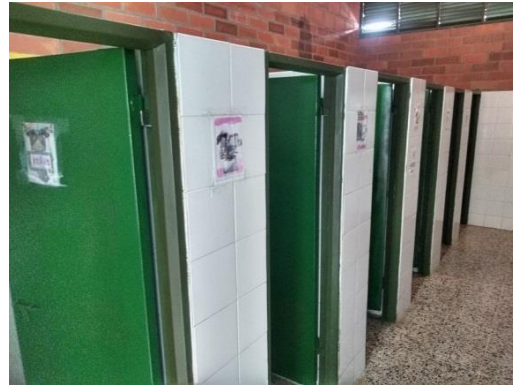
Actividad: Adecuación puertas baños niñas Lugar: Baños Institución Educativa