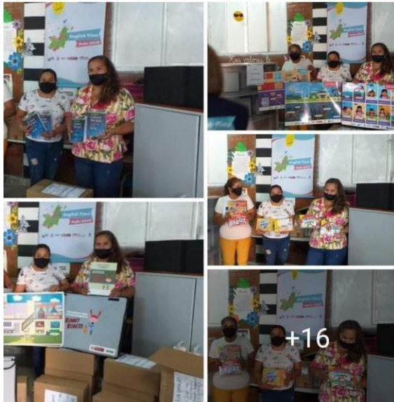
Actividad: Entrega de recursos pedagógicos de Bilingüismo Lugar: Sede Principal Juan de Dios Girón

Hoy fue un excelente y bendecido día para nuestra I. E. Juan De Dios Girón. Recibimos gran cantidad de recursos pedagógicos del Proyecto de Bilingüismo, para Educación Básica Primaria, Secundaria y Media Técnica por parte de Secretaria de Educación Dptal.