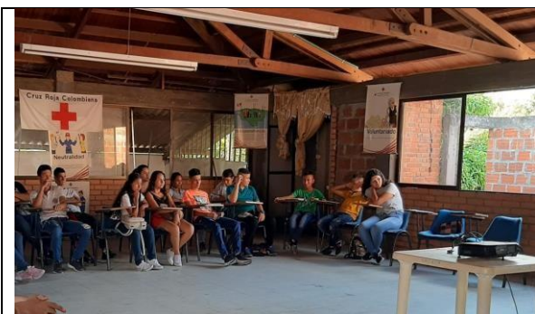
Actividad: Conferencia con la CVC