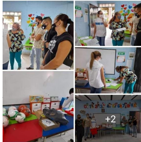
Actividad: Entrega de material didáctico Proyecto de Inclusión Lugar: Sede Principal Juan de Dios Girón

Entrega de material didactico para el proyecto de Inclusión de La I. E. Juan De Dios Giron por parte de la Secretaria de Educación Departamental.