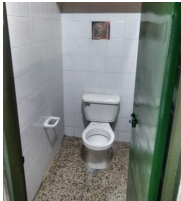
Actividad: Sanitario niñas Lugar: Baños Institución Educativa