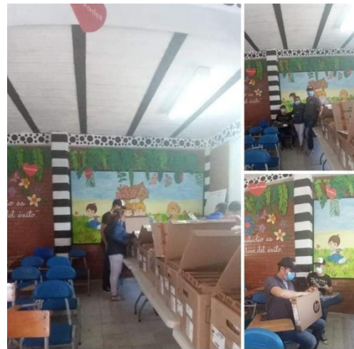
Entrega de material didáctico Educación Vial Sede Principal IE Juan de Dios Girón