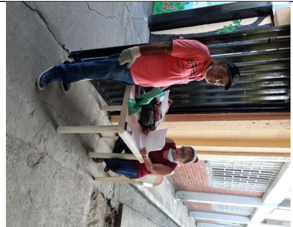
Actividad: Proyecto inducción al nuevo personal Lugar: I.E. JUAN DE DIOS GIRON