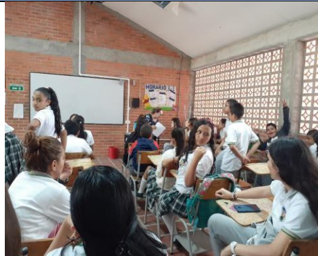
Actividad: Conformación de Comités (PRAE) Lugar: I.E. JUAN DE DIOS GIRON