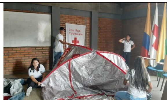
Actividad: Labor social