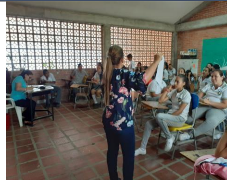
Actividad: Conformación de Comités (PRAE) Lugar: I.E. JUAN DE DIOS GIRON