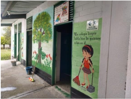
Actividad: Adecuación puertas baños Lugar: Baños Institución Educativa