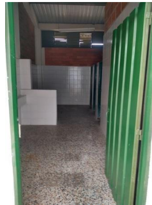
Actividad: Baños niños Lugar: Baños Institución Educativa