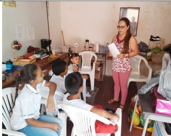
Actividad: Proyecto inducción a los estudiantes de primaria. Lugar: I.E. JUAN DE DIOS GIRON