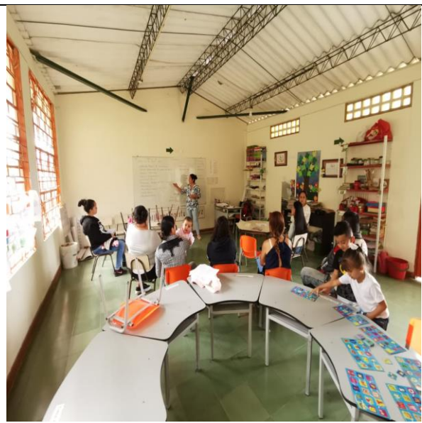
Actividad: Escuela para Padres