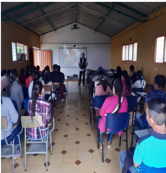
Actividad: Elección representantes Consejo de Padres