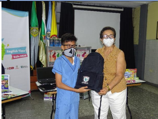
Actividad: Entrega de kits escolares por la Gobernación del Valle del Cauca