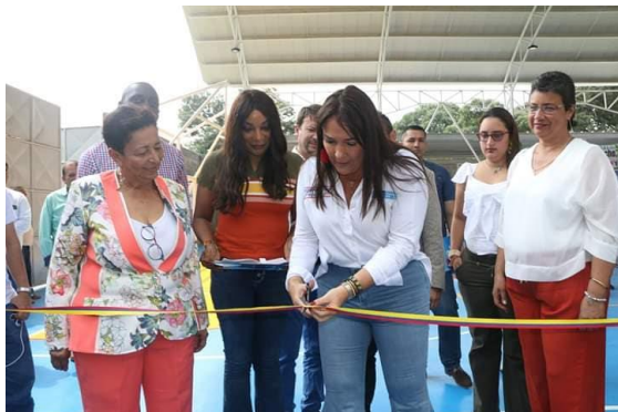
Actividad: Inauguración Multideportivo