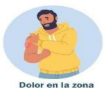
Dolor en la zona de la vacunación