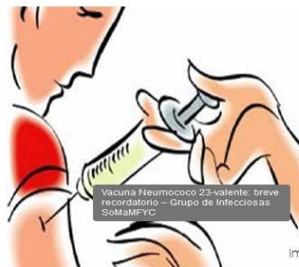
Vacuna Neumococo 23-valente. Breve recordatorio - Grupo de infecciones SoMaMFYC